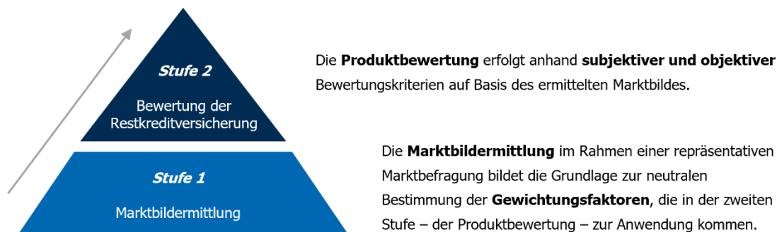
Abbildung 1: Bewertungs-Modell

Das Bewertungs-Modell basiert auf einem zweistufigen Konzept. In einer ersten Stufe werden mittels einer repräsentativen Marktbefragung auf neutralem Weg die Gewichtungsfaktoren ermittelt, die bei der zweiten Stufe – der Bewertung der Restkreditversicherung – zur Anwendung kommen.