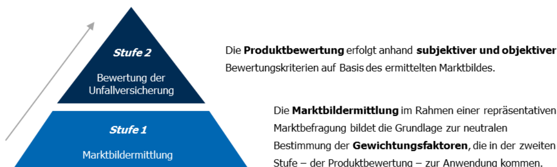
Abbildung 1: Bewertungs-Modell

Das Bewertungs-Modell basiert auf einem zweistufigen Konzept. In einer ersten Stufe werden mittels einer repräsentativen Marktbefragung auf neutralem Weg die Gewichtungsfaktoren ermittelt, die bei der zweiten Stufe – der Bewertung der Unfallversicherung – zur Anwendung kommen.