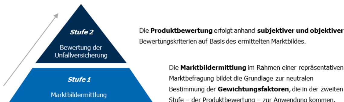
Abbildung 1: Bewertungs-Modell

Das Bewertungs-Modell basiert auf einem zweistufigen Konzept. In einer ersten Stufe werden mittels einer repräsentativen Marktbefragung auf neutralem Weg die Gewichtungsfaktoren ermittelt, die bei der zweiten Stufe – der Bewertung der Unfallversicherung – zur Anwendung kommen.