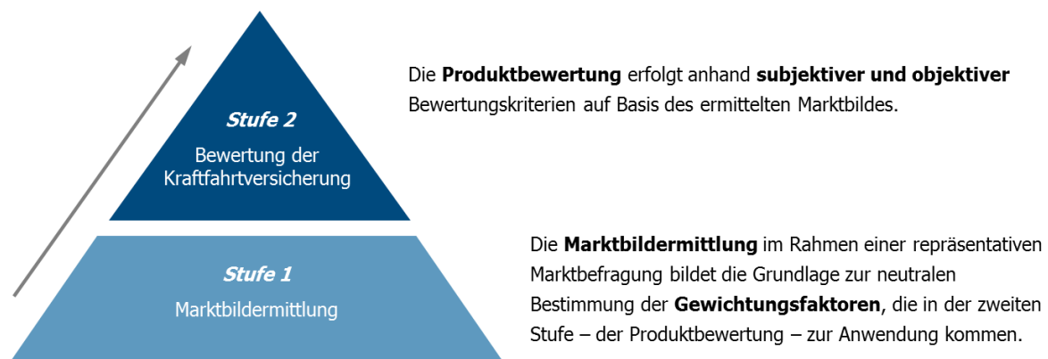
Abbildung 1: Bewertungs-Modell

Das Bewertungs-Modell basiert auf einem zweistufigen Konzept. In einer ersten Stufe werden mittels einer repräsentativen Marktbefragung auf neutralem Weg die Gewichtungsfaktoren ermittelt, die bei der zweiten Stufe – der Bewertung der Kraftfahrtversicherung – zur Anwendung kommen.