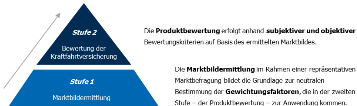
Abbildung 1: Bewertungs-Modell

Das Bewertungs-Modell basiert auf einem zweistufigen Konzept. In einer ersten Stufe werden mittels einer repräsentativen Marktbefragung auf neutralem Weg die Gewichtungsfaktoren ermittelt, die bei der zweiten Stufe – der Bewertung der Kfz-Versicherung – zur Anwendung kommen.